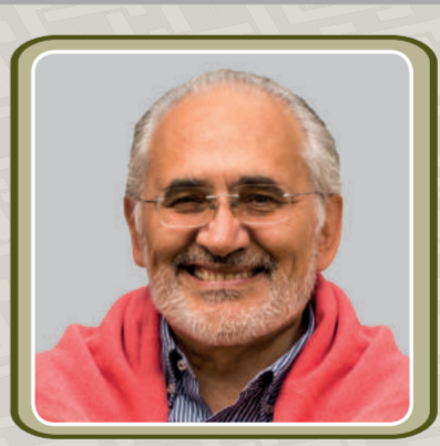
PRESIDENTE CARLOS DIEGO DE MESA GISBERT