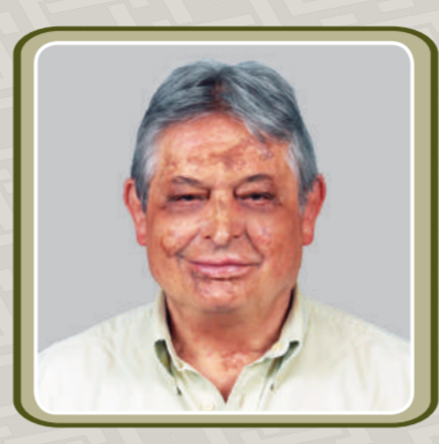
PRESIDENTE JAIME PAZ ZAMORA