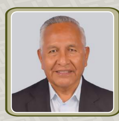
PRESIDENTE VICTOR HUGO CARDENAS CONDE