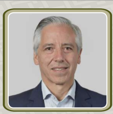
VICEPRESIDENTE ALVARO MARCELO GARCIA LINERA