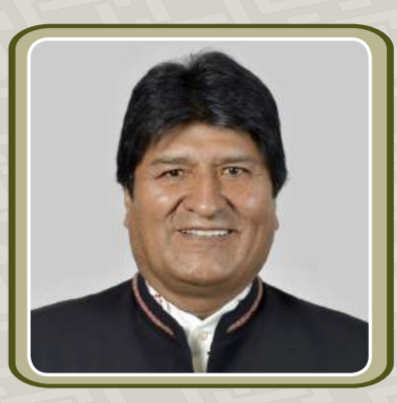
PRESIDENTE JUAN EVO MORALES AYMA